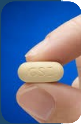
SOVALDI - antiviraux d'action directe (AAD)